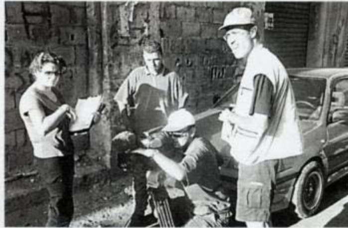
خلال تصوير "بيروت وجهات نظر"